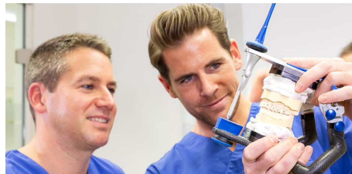
Höchste Qualität entsteht in den Implantatzentren durch die enge Abstimmung hoch spezialisierter Zahnärzte. Kollegen, die schon früher zum Team gehörten, wurden nun zurückgewonnen und tragen zum Wissenstransfer bei.

Kontinuität an den Standorten Bad Wörishofen, Weingarten und Unterschleißheim ist gewährleistet